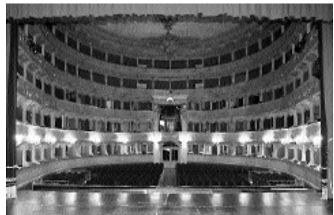
TEATRO Platea e galleria del Sociale di Como